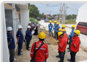
Dokumentasi Uji Praktek