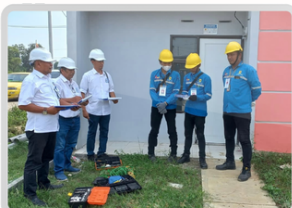
Dokumentasi Uji Praktek