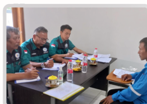
Dokumentasi Uji Wawancara