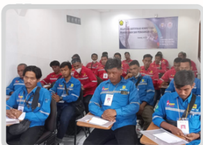
Dokumentasi Uji Tulis